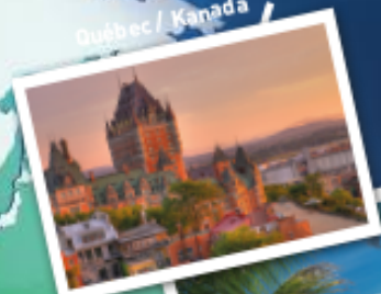
Québec / Kanada